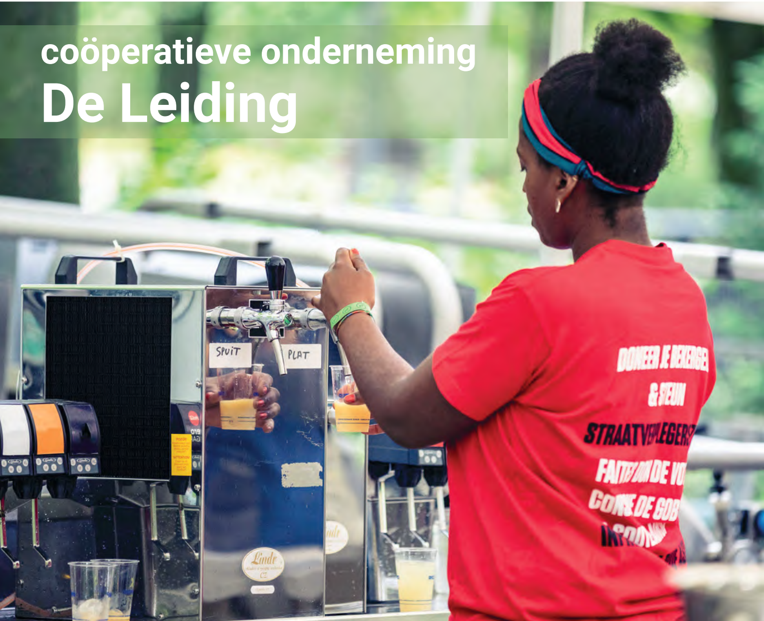
De Leiding op Boterhammen in het Park