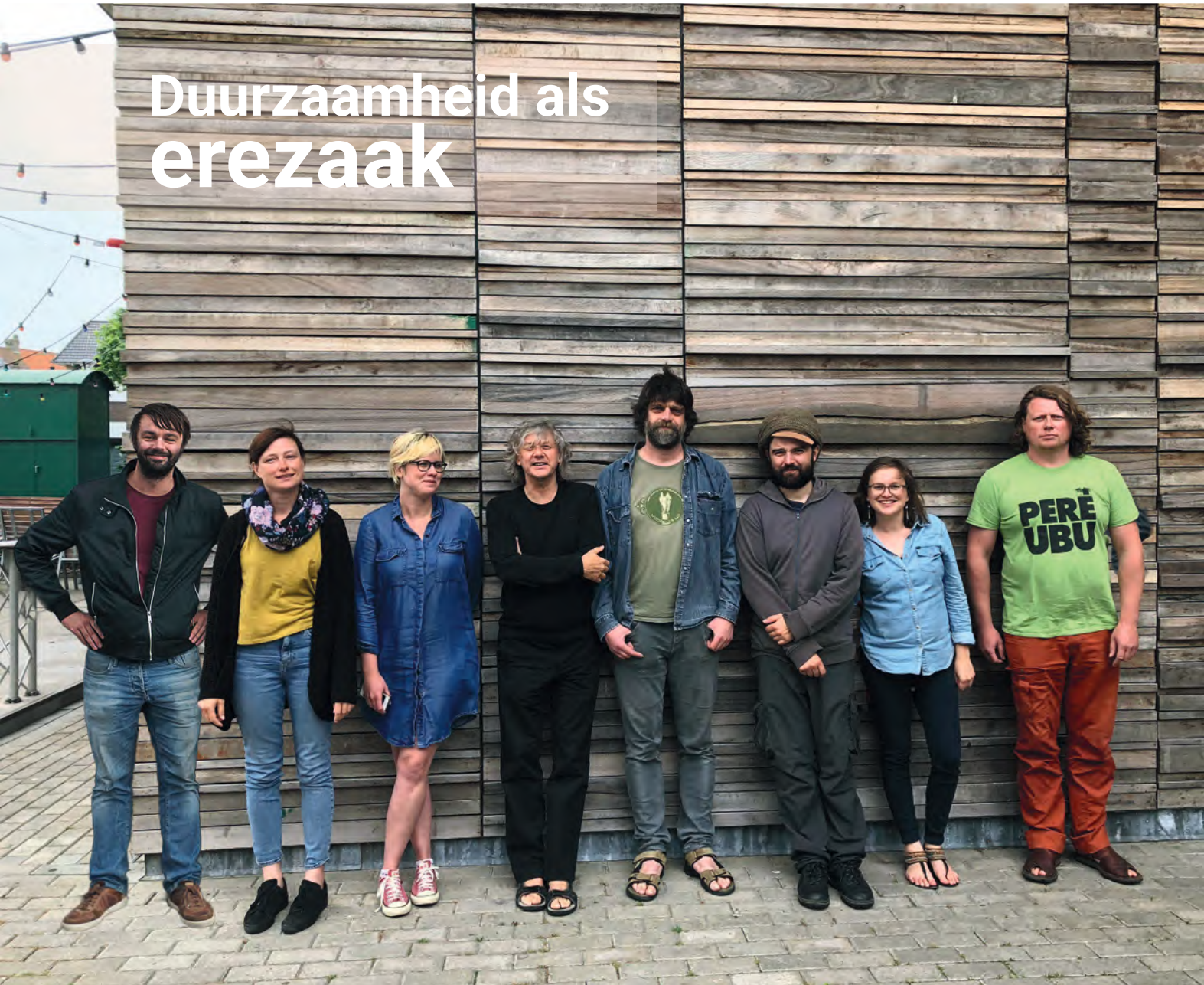
Het geniale team achter het milieubewuste 4AD muziekclub